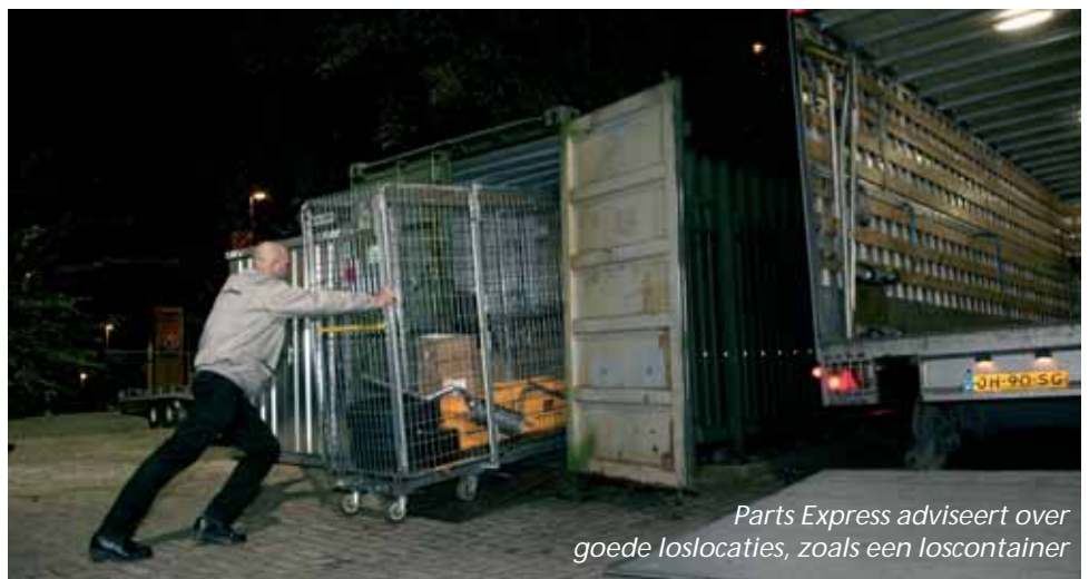
Parts Express adviseert over goede loslocaties, zoals een loscontainer

De gewenste onderdelen vóór 8 uur 's ochtends in huis? Zodat uw medewerkers er direct mee aan de slag kunnen? Dan is de Nachtdistributie van Parts Express een oplossing. Steeds meer klanten profiteren van de voordelen.