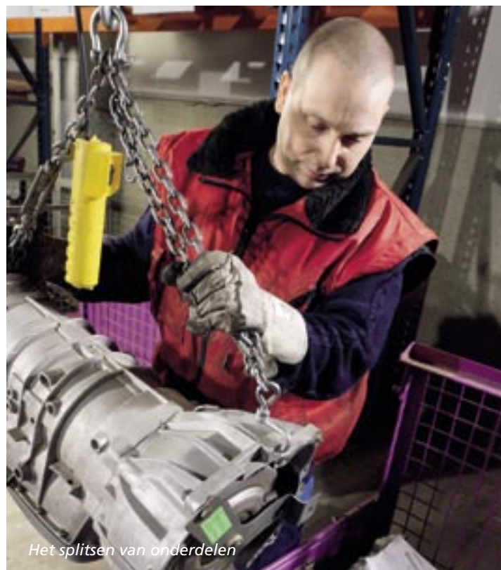
Het splitsen van onderdelen

Parts Express handelt ook de emballageflow af voor de betreffende autofabrikant. Dagelijks komen vanuit de dealers verschillende typen boxen en containers leeg terug op het depot in Mechelen. Verhulst: "We krijgen rolcontainers binnen, Gitterboxen, G6- en G7-bakken en vier soorten plastic bakken." Deze moeten worden verzameld, opgeschoond (denk aan het verwijderen van adresstickers) en gesorteerd per soort. "Daar zorgen wij voor, zodat ze clean en overzichtelijk terug kunnen naar de juiste klant voor hergebruik. Zo is de cirkel mooi rond."